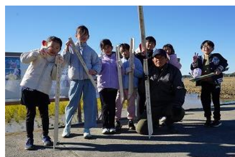
3年生:白鳥を迎える会