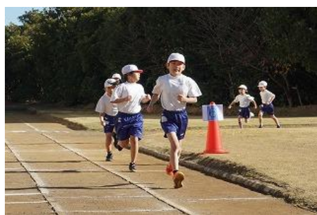
持久走記録会(2年生)