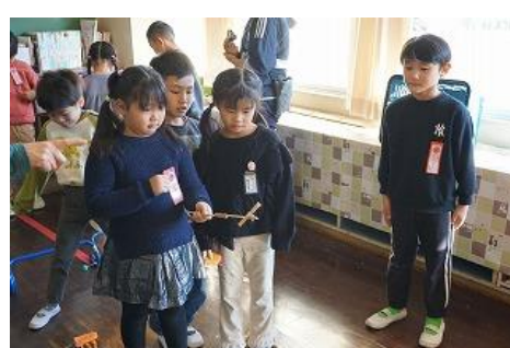
2年生:1年生とクリスマス会