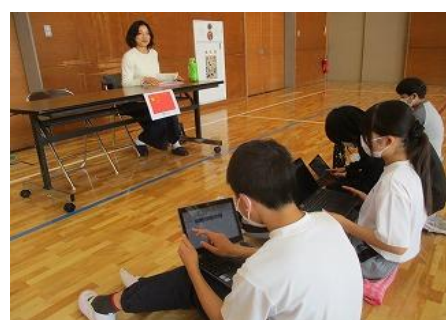
ちば多文化みらい共創講座(5・6年生)