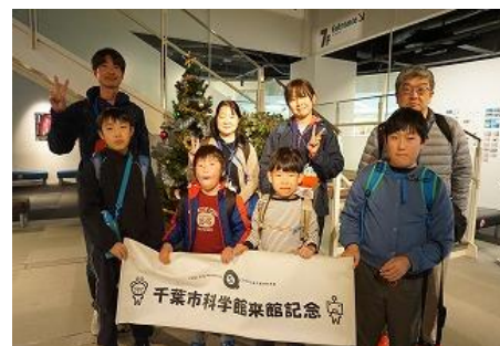
ステップ・のびのび校外学習