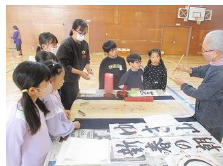
書き初め練習会(3年生)