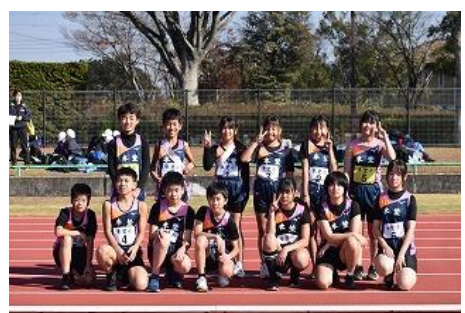
印西市小学校駅伝競走大会