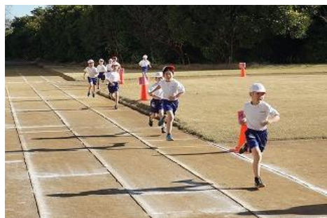
持久走記録会(1年生)